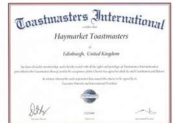
トーストマスター修了証