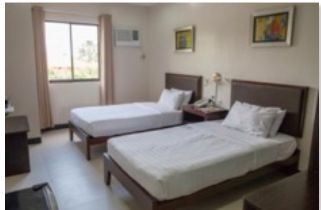
ホテル寮ツインルーム