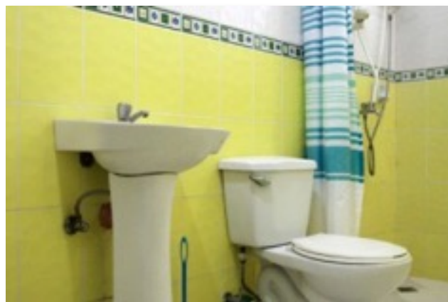
トイレ&ホットシャワー