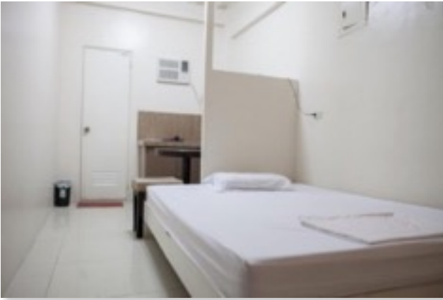
エコノミー1人部屋