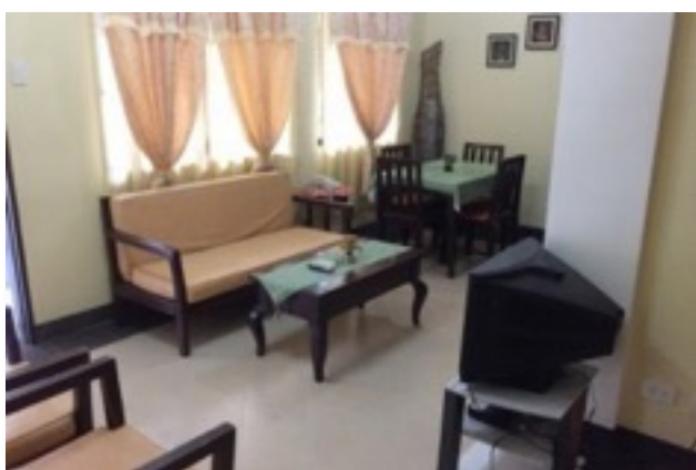
外部4人部屋 リビングルーム