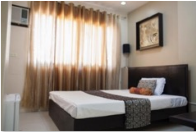
スタンダード1人部屋