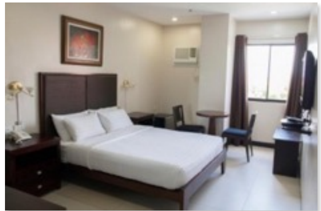
ホテル寮シングルルーム