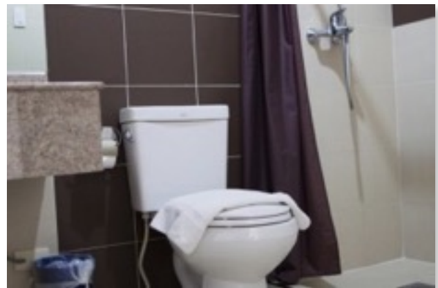
ホテル寮バスルーム